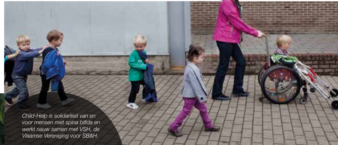
Child-Help is solidariteit van en voor mensen met spina bifida en werkt nauw samen met VSH, de Vlaamse Vereniging voor SB&H.

Child Help staat met een infostand op Wereldfeesten en infodagen, geeft lezingen op aanvraag en organiseert activiteiten zoals toneelvoorstellingen en tentoonstellingen.