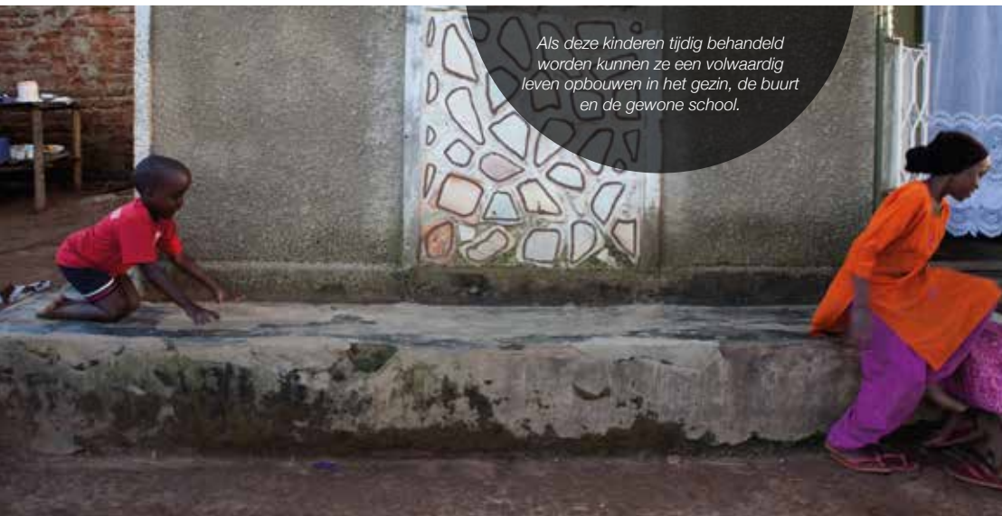
Als deze kinderen tijdig behandeld worden kunnen ze een volwaardig leven opbouwen in het gezin, de buurt en de gewone school.

De tijdig behandelde kinderen zijn de beste ambassadeurs voor onze projecten. Zij bewijzen dat het leven met deze handicaps waardevol is en herstellen het geloof en de hoop van de bevolking in kinderen met een aangeboren handicap.