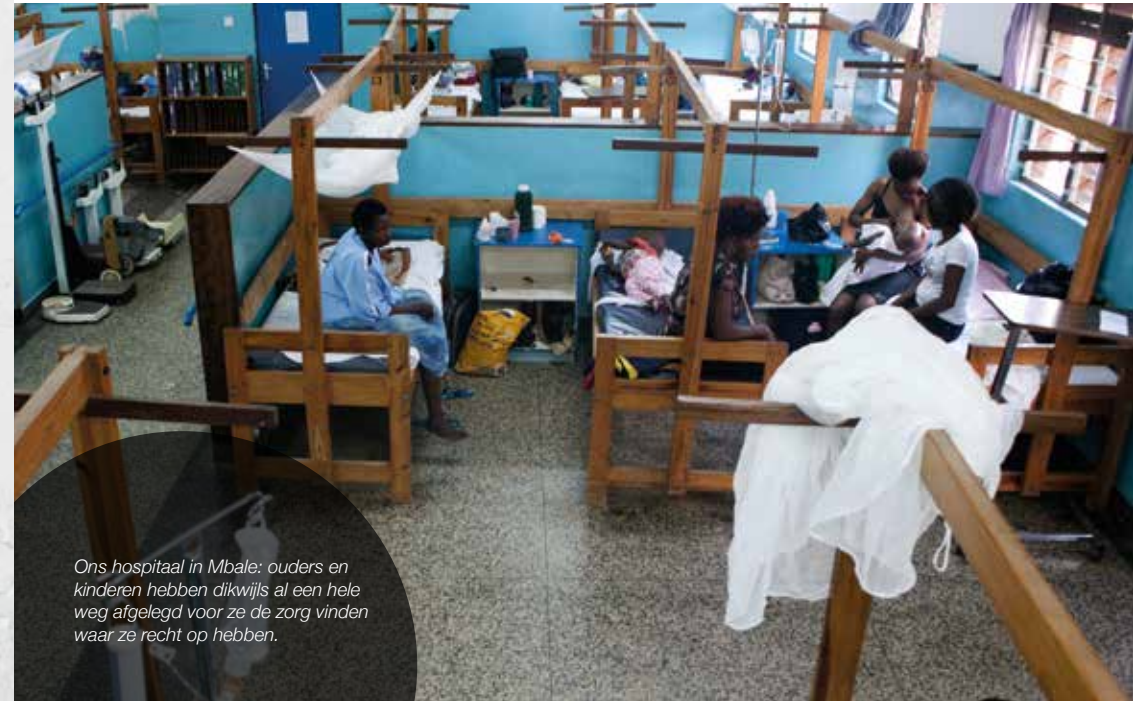
Ons hospitaal in Mbale: ouders en kinderen hebben dikwijls al een hele weg afgelegd voor ze de zorg vinden waar ze recht op hebben.