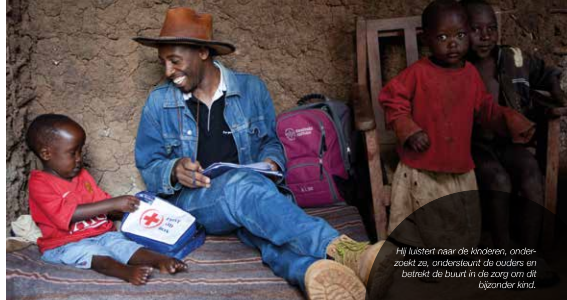
Hij luistert naar de kinderen, ondersteunt de ouders en betrekt de buurt in de zorg om dit bijzonder kind.

In rurale gebieden kent men spina bifida en hydrocefalie, maar men heeft geen weet van de bestaande behandelingen. De jonge ouders gaan in eerste instantie met hun medische problemen naar lokale helers die spina bifida en hydrocefalie zien als onverenigbaar met het leven. Ze geven dikwijls ouders de schuld behekst te zijn en doen duiveluitdrijvingsrituelen waarbij ze soms met gloeiende ijzeren staven het hoofd van het kindje verbranden als vorm van 'behandeling'. Naast de verschrikkelijke brandwonden wordt er door deze praktische kostbare tijd verloren waardoor veel kinderen extra handicaps oplopen zoals een te groot hoofd, zwaardere verlammingen en blindheid.