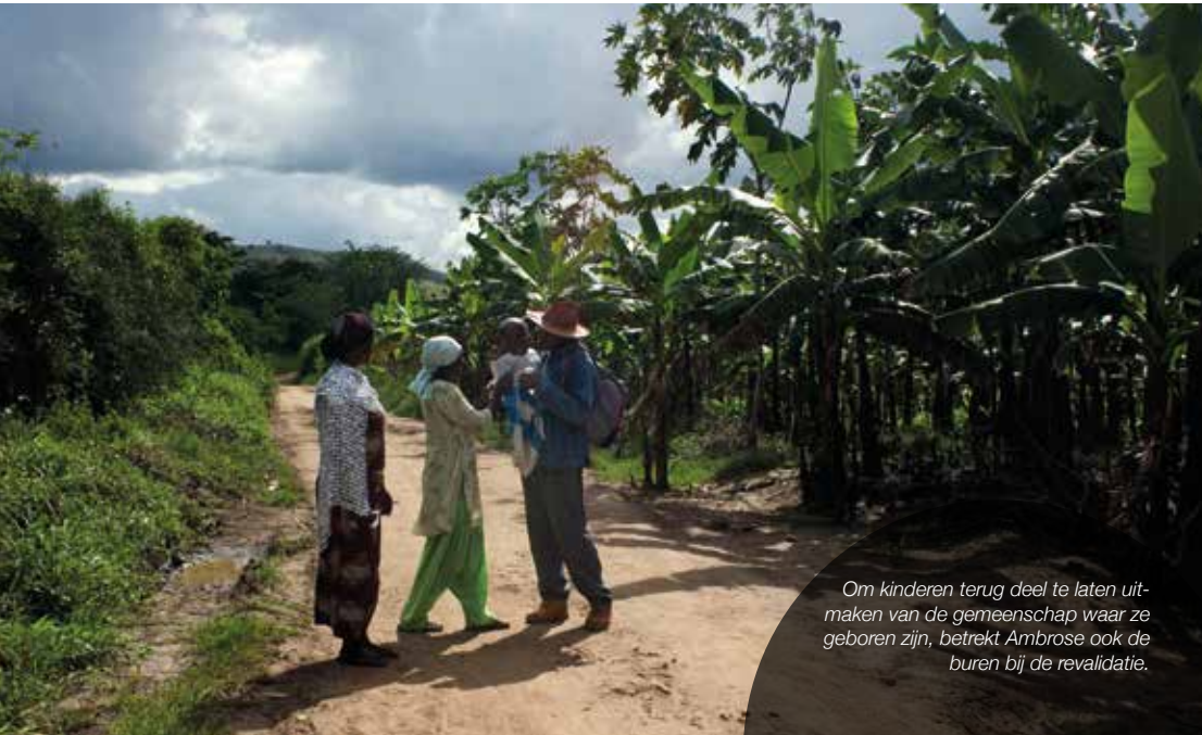
Om kinderen terug deel te laten uitmaken van de gemeenschap waar ze geboren zijn, betreft Ambrose ook de burens bij de revalidatie.

Steun Child-Help en geef kinderen met een aangeboren handicap in ontwikkelingslanden een eerlijke start.