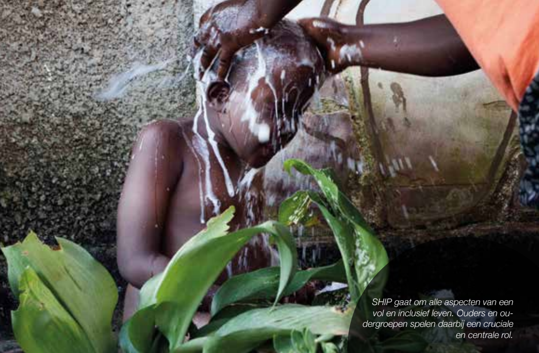
SHIP gaat om alle aspecten van een vol en inclusief leven. Ouders en oudergroepen spelen daarbij een cruciale en centrale rol.

incontinent. Dit hindert de integratie in de maatschappij en ook met scholing en later met tewerkstelling zijn er dikwijls problemen die extra aandacht vragen.